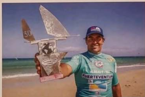
TEXTES : Anne Sophie Niel

IL VA ÊTRE NOMINÉ 13 FOIS COMME MARIN DE L'ANNÉE ET REMPORTER LE TITRE EN 2010 DÉCERNÉ PAR LA FÉDÉRATION FRANÇAISE DE VOILE